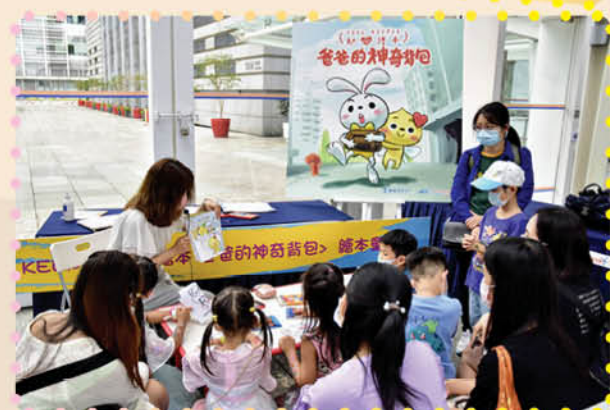
於同樂日推出《SOUL Keeper 知心繪本 — 爸爸的神奇背包》，並即場分享故事內容