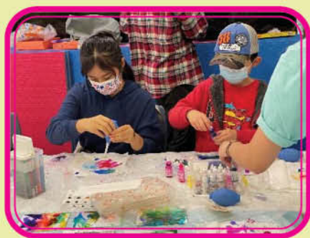
參加者學習酒精墨水畫