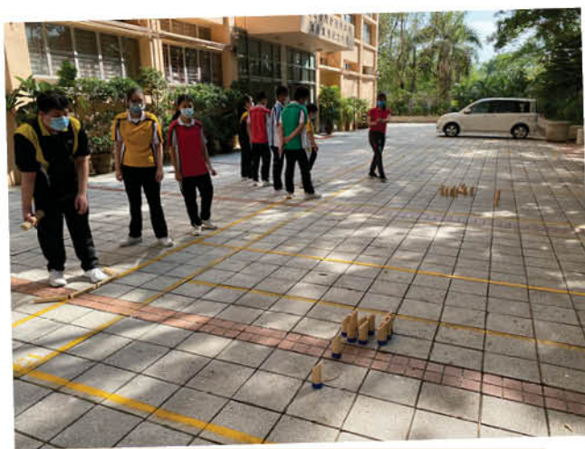
學生專注鎖定目標，準備拋擲木棋