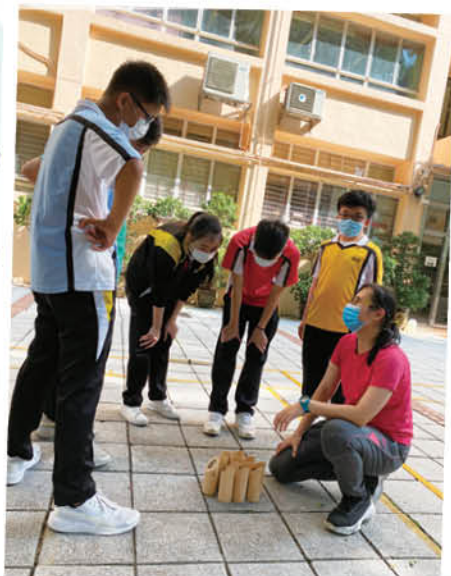
學生專心聆聽導師講解「芬蘭木柱」的玩法及規則

透過身心靈健康計劃，讓學生持續參與不同的體驗活動，推動他們遠離壓力來源，更透過體驗學習鼓勵學生調整心態、照顧自己的需要，協助學生於疫情中達至身心靈的平衡。