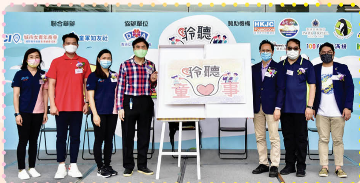
童聲同戲 — 陪我講故事暨親子同樂日

在家庭層面，整個計劃於2021年初開始推行，當中有接近300個家庭參與當中。在計劃的過程中，我們舉辦了讓家長及兒童相處的活動，提升家長及兒童的交流，如親子瑜伽、母親節親子曲奇製作、親子尋蛋挑戰、父親節親子網上挑戰及親子繪本發佈會等。這些活動當中亦滲入SOUL的技巧及元素讓家長能從中學習及應用。參加的家庭亦有分享在家中實踐SOUL的技巧，其中有2個家庭的分享最為深刻。其中一個家庭提到，在家中與孩子相處時運用了SOUL技巧後，更能理解孩子行為背後的情緒及其需要，滿足孩子的情緒需要後，孩子便更容易與自己溝通及妥協共同訂立的決定。