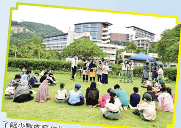
了解少數族裔文化