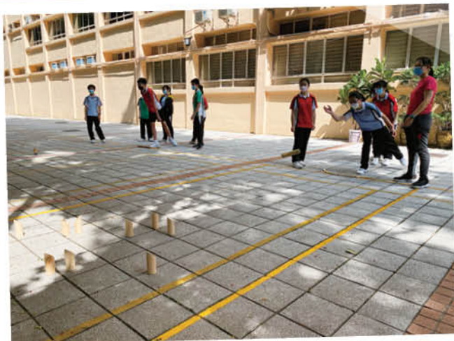
學生對準目標拋擲木棋，獲取指定分數