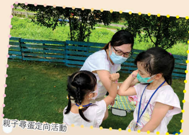
親子尋蛋定向活動