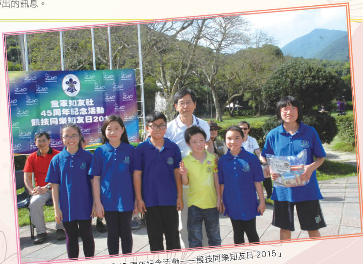
攝於 2015 年 3 月 29 日「45 周年紀念活動——競技同樂知友日 2015」

訪問開始時，周律師表示自己沒有太多別離的經驗，最深刻的是兩名至親離世，後來他分享成為律師及兄弟三人成長過程時，發現轉換工作或兄弟出國讀書，其實他與別離不經不覺已有很多次相遇。當別離是無法避免，我們就要學習珍惜與重視的人相處相聚的時刻。因為有愛，所以別離時感到不捨和難過；縱使別離，我們用愛彼此維繫、珍惜相處時光，就是今期主題「愛·別離」想帶出的訊息。