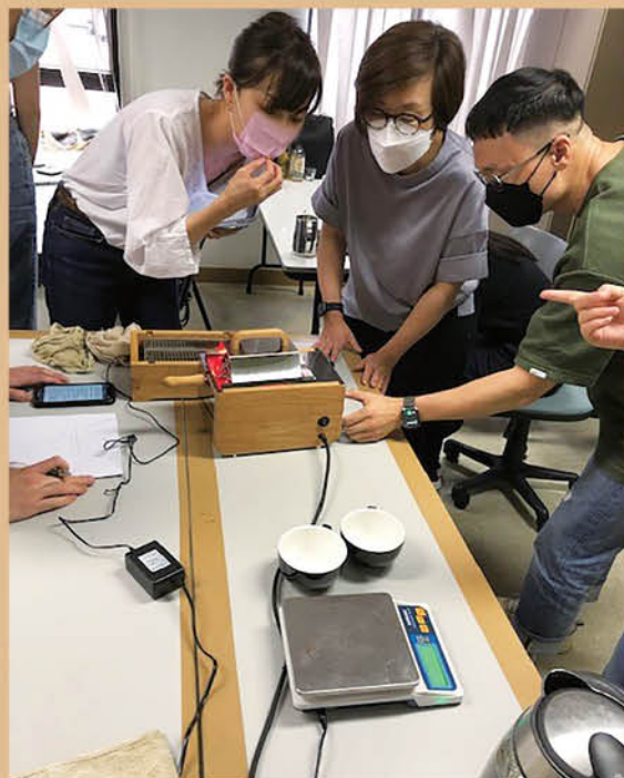
學習咖啡烘焙機的使用方法