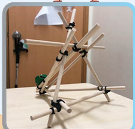
學生初次認識羅馬炮架，順利完成製作