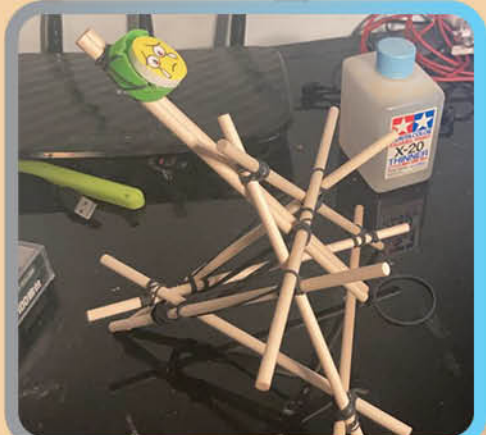
學生發揮創意，改裝迷你炮架