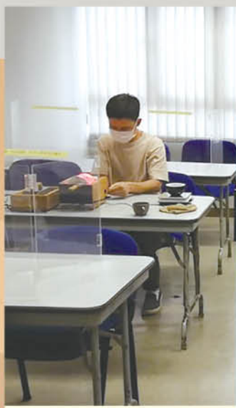
咖啡烘焙 — 期末實務試

中心開辦此課程時間雖短，但畢業率卻達九成，學員可透過此課程認識咖啡生豆及辨識瑕疵豆、咖啡烘焙的原理及基本技巧、掌握咖啡烘焙機的使用方法及咖啡烘焙的品質監控等，增加學員日後投身咖啡行業的就業能力及機會。