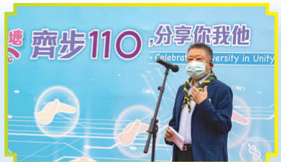
平等機會委員會朱敏健主席致辭