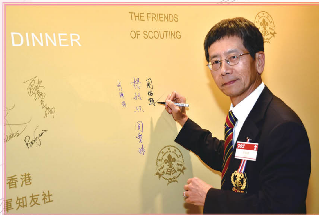
攝於 2019 年 7 月 12 日「金禧紀念晚宴 暨 2019/2020 年度社務委員會就職典禮」