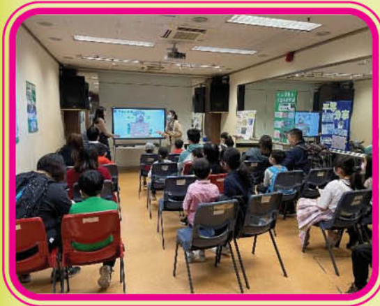
平等大使講解「平等分享」概念

平等分享是一種心態，每個人因應自己的資源及能力去付出，將你所擁有的與人分享，不一定是物資的分享，你所擁有的技能也可以成為分享的橋樑，例如：教長者操作智能電話、教小朋友手工藝、教少數族裔兒童中文等，並沒有受特定服務對象所限制。社會資源有限，大多數人會選擇將這些資源分配予已被標籤的人身上，如露宿者、獨居長者，又或是街上「執紙皮」的長者等，但事實上社會有需要的人比想像的還要多，例如疫情開始後，外出時會忘記帶口罩的你、上車後發現沒有攜帶紙巾的我，或者是家庭有突發需要的他等，都是「有需要的人」。計劃希望透過平等分享，讓大家明白到每個人都可以是受眾，減低社會對於「有需要」的標籤。