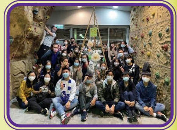
籌委會成員及平等大使合照

計劃為青年人提供訓練包括：認識何謂「平等分享」、探訪劏房戶及低收入家庭、了解社區上不同的弱勢社群、學習策劃、組織及推行平等分享活動、學習拍攝及剪輯影片等，期望年輕人分享自己的時間、技能及生活智慧，明白到任何人都可以是受助者及分享者。