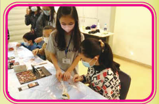
義工教授如何用過期化粧品製作環保水彩畫