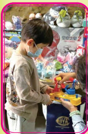
參加者於「只送不賣」物資分享區域，選取合適及需要的物資