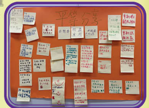
平等大使對平等分享的看法及對計劃的期望

工作坊共有 66 名中學生參與活動，成為「平等大使」，過程中讓「平等大使」了解計劃理念外，亦讓他們於社區進行探索，學習觀察「有需要的人和事」。