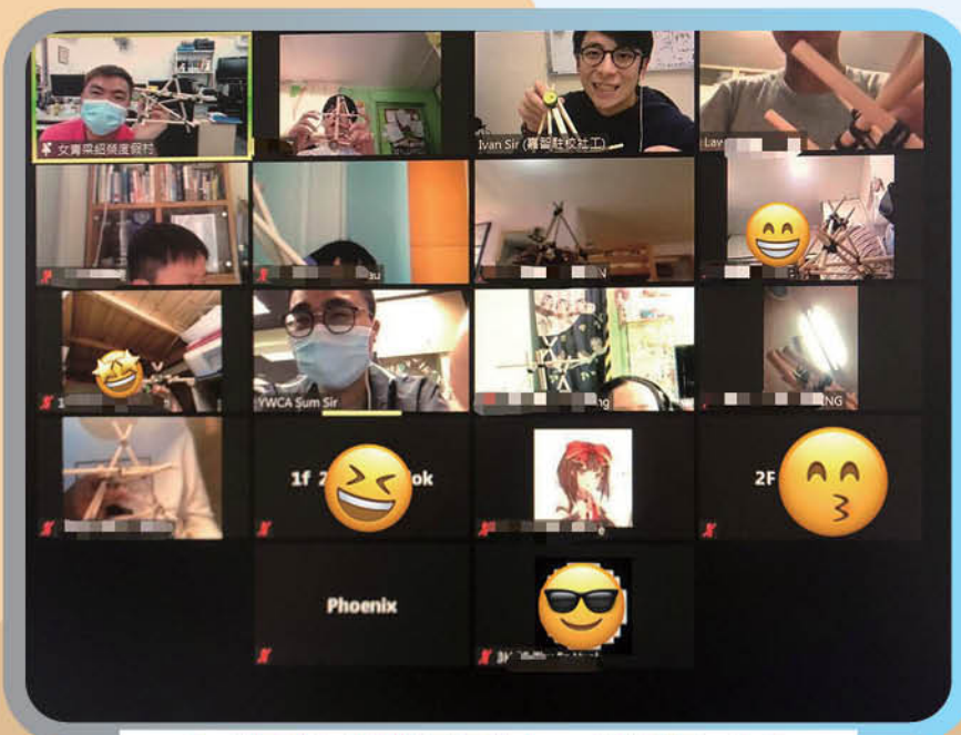
學生順利完成製作羅馬炮架，向導師展示作品