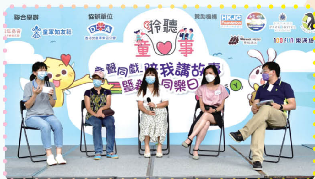
家長於同樂日中作分享

1 SOUL Keeper 理念可參照本社訊第 15 頁之「Cheer 嘢·心呼吸」青少年精神健康計劃內文。