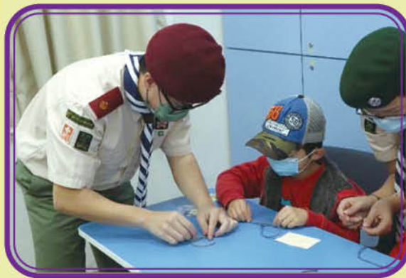
童軍成員教授參加者以漁翁結製作手繩，並提供額外材料包，鼓勵他們向友儕傳授。