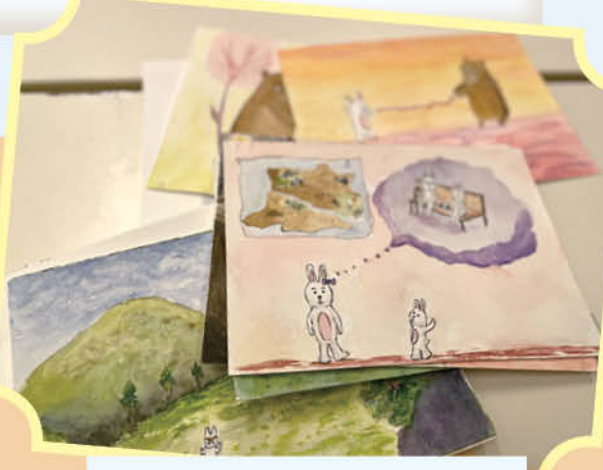
婦女義工創作的繪本插圖手稿