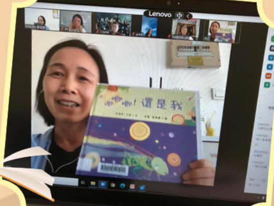
講故事義工訓練小組於網上學習說故事技巧