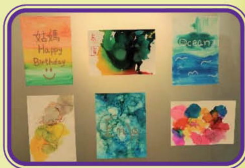
酒精墨水畫製成品