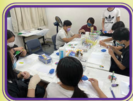
平等大使學習製作酒精墨水畫

「平等大使」經歷兩個月的籌備工作，最終在 11 月舉行了兩次「共享街站」，藉此向社區宣揚平等分享概念，並將事前於社區收集的物資以地攤形式與社區人士共享，建立社區互助和共享的氛圍，也期望受眾反思「需要」與「想要」的分別，學習將資源留給有需要的人。另外，街站亦提供兩個手作工作坊供街坊參與，分別是「酒精墨水畫」及「環保水彩工作坊」。「酒精墨水畫」是讓參加者於製作過程享受獨處的時間，感受藝術所帶來的療愈感，而「環保水彩工作坊」則以收集到的過期或二手化妝品加工成水彩，讓參加者反思購物的需要。