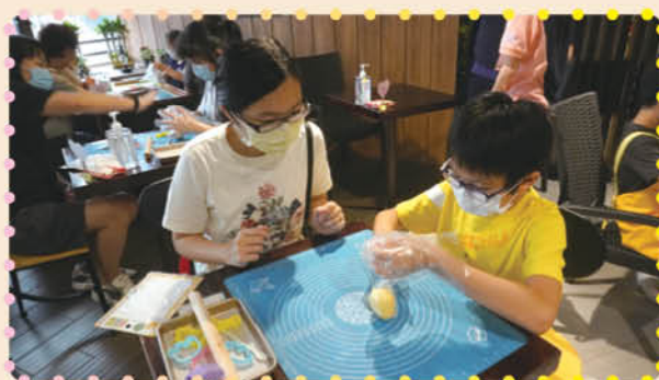
“Cooking mama” 活動